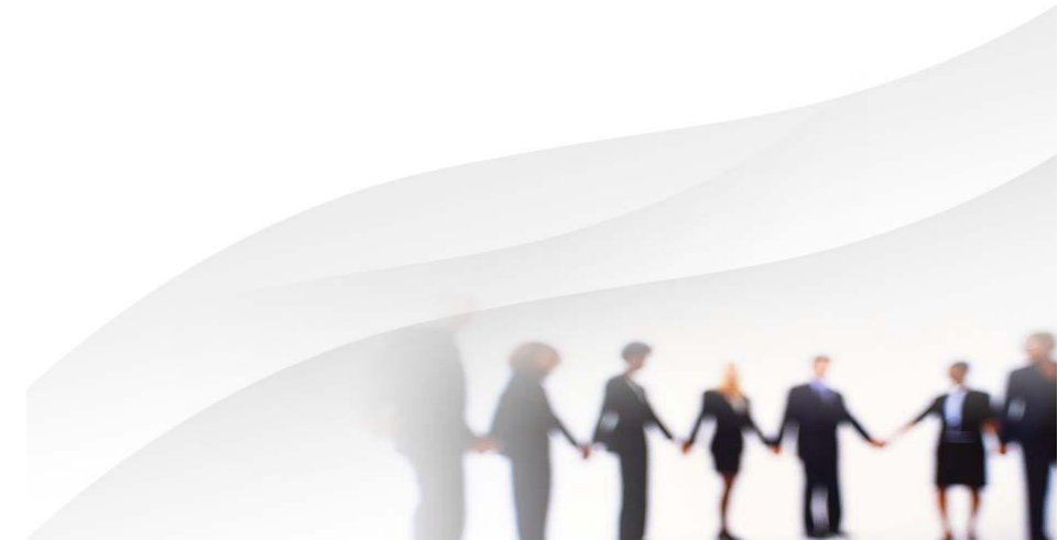
Foto work product (optional)